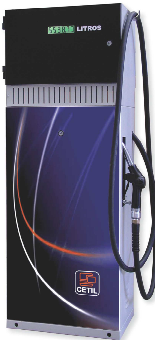
Unidad de suministro E-12 caudal máximo 80 L/min.