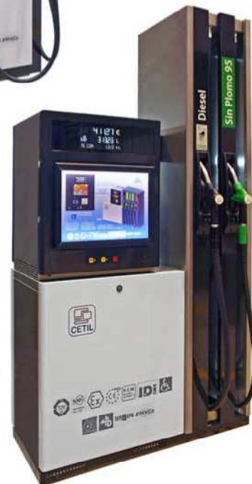
Surtidor / Dispensador E30 B multiproducto con 2 mangueras, dos puntos de suministro y pulsador para sistema bicaudal "TURBO" (50L/min.-80L/min).