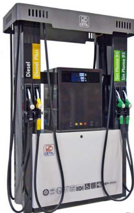
Surtidor / Dispensador E30 W multiproducto con 8 mangueras y dos puntos de suministro.