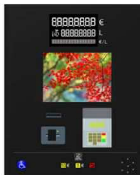
Sistema de pago con todas las certificaciones actuales en España. Espacio preparado para instalar sistemas de pago de otras marcas. Pulsador de aviso para personas Discapacitadas en sillas de ruedas con posibilidad de interfonía. Posibilidad colocación anuncio estático iluminado mientras no se instale sistema multimedia.